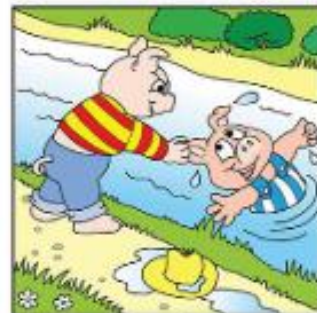
Tharraing a chara amach é.