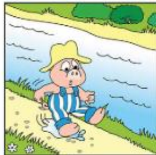
Sciarr a chos.