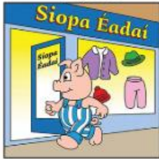
Chuaigh Micilín Muc go dtí an siopa.