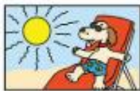
te agus tirim