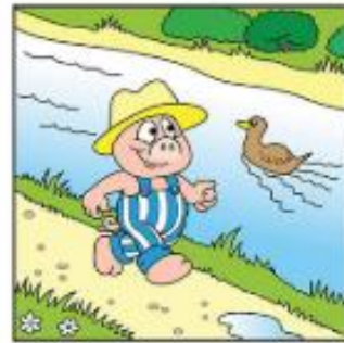
Tháinig sé abhaile.