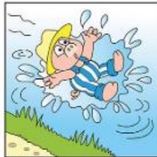
Thit sé isteach san uisce.