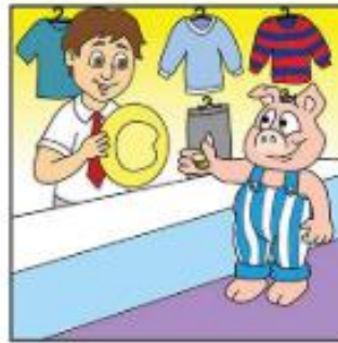
Cheannaigh sé hata.