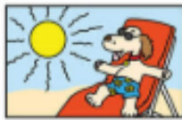
te agus tirim